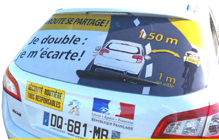
Marquage arrière qui rappelle la règle des 1,50 m

Différents objets marqués et imprimés seront distribués au grand public.