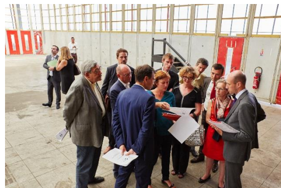
Visite de site à Clichy-La-Garenne