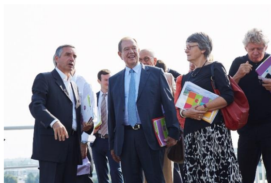
Visite de site à Lieusaint