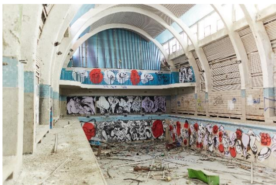
Visite de site à Saint-Denis