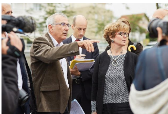
Visite de site à Arcueil

D'autres sites sont des histoires à écrire de la mutation urbaine de la métropole du XXI ème siècle : des friches industrielles, comme Babcock à La Courneuve ou l'ancienne usine EIF sur le Mur à Pêches à Montreuil, le site mythique de l'ENS à Cachan.