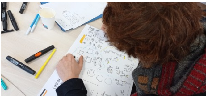
Atelier facilitation graphique

Chaque année la PFRH vous concocte une offre spécifique à découvrir pendant le mois de l'innovation publique. Cette année, en plus des formations autour du management à distance qui ont toujours toute leur place, nous avons axé notre proposition sur la découverte de pratiques innovantes et sur votre bien-être.